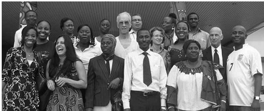
Исследовательская группа IASAP, г. Абуджа, Нигерия, 19 – 21 октября 2009 г.

Биологические, психологические и социальные элементы могут подпадать под каждую категорию. К ограничениям модели четырех Р относятся: нестандартный формат (формулировку не начинают с «предрасполагающих факторов»), а также неудобное взаимное наложение категорий. Имеет место незначительная консолидация многих факторов, за исключением того, как они влияют на симптоматику пациента, хотя сильной стороной этой модели является то, что она, тем не менее, четко систематизирует потенциальные этиологические факторы.