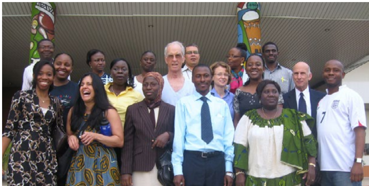
Asistentes y académicos, Grupo de Estudio de la IACAPAP en Abuya, Nigeria, 2010

respecto a la organización de los servicios de salud mental. También se aplica a los servicios de SMNA. La pirámide destaca el hecho de que los servicios terciarios y especializados son muy costosos y necesarios sólo para una pequeña parte de la población, mientras que los servicios informales, comunitarios y de atención primaria se pueden proporcionar a un coste relativamente bajo y se necesitan con mayor frecuencia.