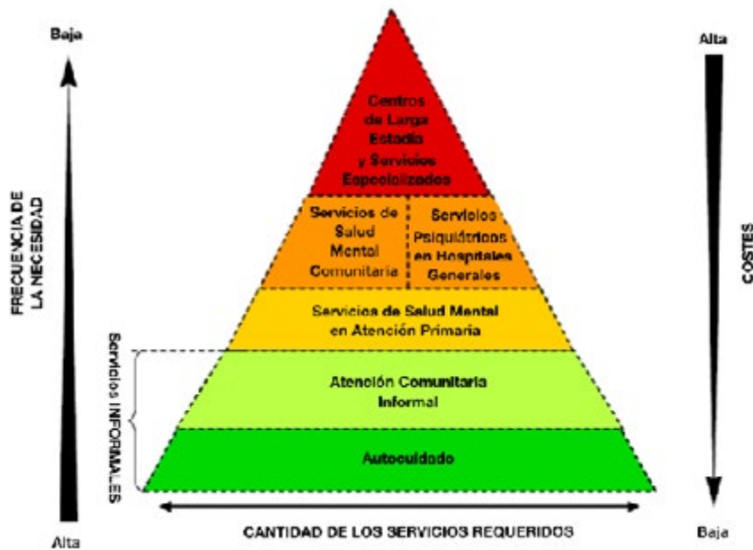
Figura J.5.1 La pirámide de la integración adecuada de servicios (OMS, 2007)

La Figura J.5.1 muestra la pirámide de la adecuada integración de los servicios, un marco desarrollado por la OMS para proporcionar orientación