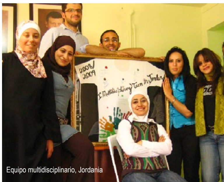
Equipo multidisciplinario, Jordania